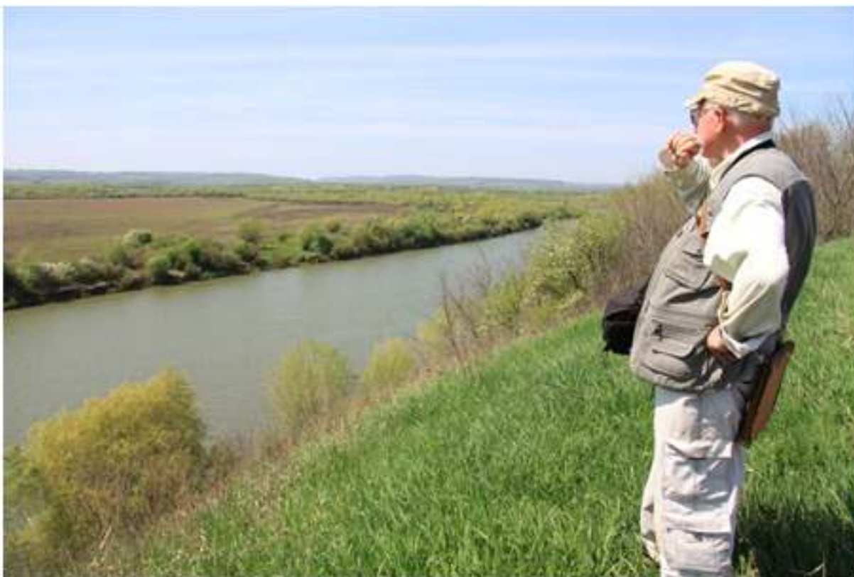
Рис. 1. Над Дністром – рікою свого дитинства. Розвідки поблизу сіл Тенетники і Мартинів у 2012 р. Fig. 1. Over Dnister – the river of his childhood. Surveys near Tenetnyky and Martyniv villages in 2012

Після проголошення незалежності України, професор, чи не перший серед польських археологів, ініціював проведення спільних українсько-польських археологічних досліджень у верхній Наддністрянщині і від 1992 р. став співкерівником археологічної експедиції, у якій упродовж 22 років активно працювали співробітники відділу археології Інституту українознавства ім. І. Крип'якевича НАН України. Співпраця реалізовувалася у межах виконання угод, підписаних спочатку між Інститутом археології і етнології ПАН та Інститутом українознавства ім. І. Крип'якевича НАН України, а пізніше з Жешівським університетом. До співпраці була залучена ще одна вагома установа – Польська академія науки і мистецтв ( PAU ).