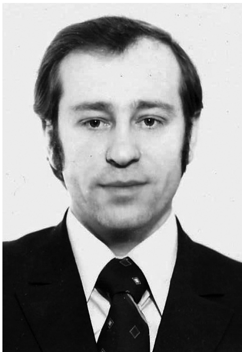
Рис. 1. Роман Грибович (1946–2011) Fig. 1. Roman Grybovych (1946–2011)

ім. І. Крип'якевича НАН України) Олександр Черниш (1918–1993). Поруч із проведенням польових досліджень, введенням у науковий обіг нових матеріалів, результатом діяльності цієї школи стало формування фахівців, які продовжили справу О. Черниша з вивчення кам'яної доби Заходу України. Одним із представників цієї школи був Роман Грибович, який багато польових сезонів брав участь у роботах палеолітичних експедицій, очолюваних Олександром Чернишем, а згодом зосередив свою увагу на дослідженні мезолітичних пам'яток Волині (рис. 1).